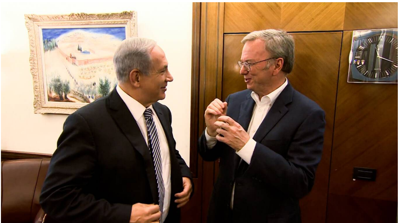
El presidente ejecutivo de Google, Eric Schmidt, se reúne con Netanyahu en su oficina de Jerusalén. Israel PM | Youtube

Pocos meses después de asociarse con Cisco Systems, Carbyne anunció su asociación con Google el 10 de julio, solo tres días después de que el financiador de Carbyne Jeffrey Epstein fuera arrestado en Nueva York por cargos federales de tráfico sexual. El comunicado de prensa de Carbyne sobre la asociación describió cómo la compañía y Google se unirían en México "para ofrecer una ubicación móvil avanzada a los centros de comunicaciones de emergencia (ECC) en todo México" luego de la conclusión de un exitoso programa piloto de cuatro semanas entre Carbyne y Google en la nación centroamericana.